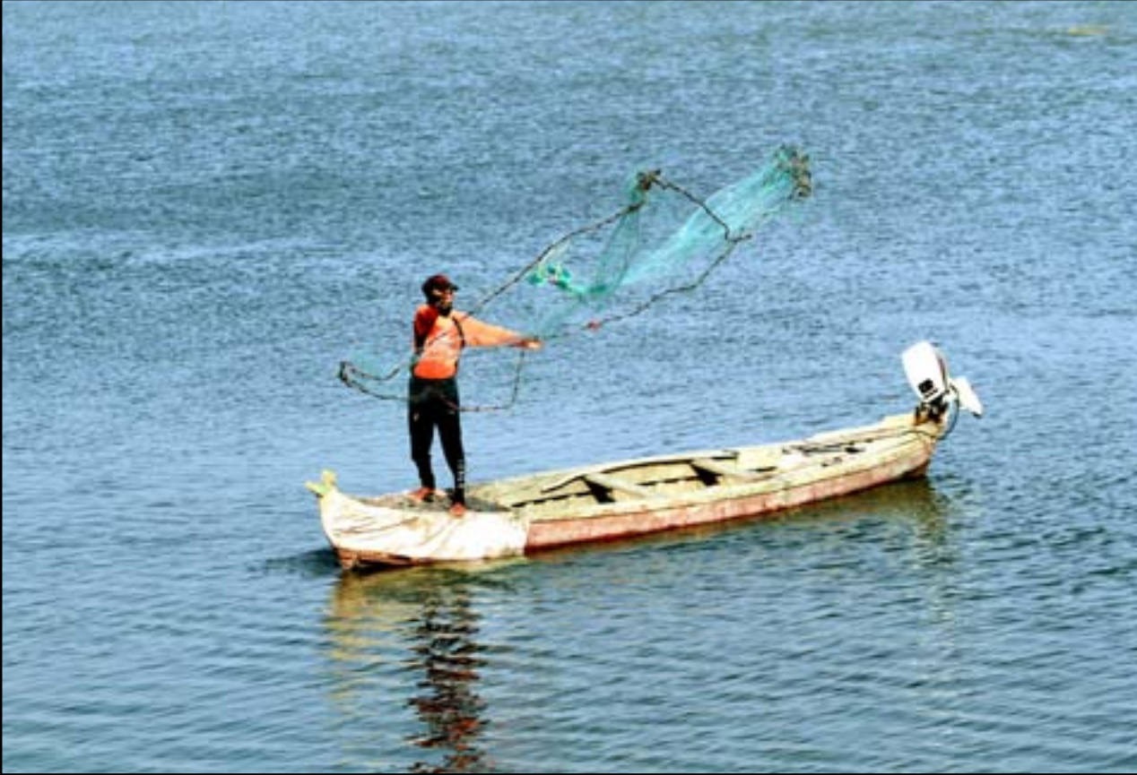
صياد يلقي شبكاه في أحد اهورا ذي قار..

البصرة تجهل مصير 12 مليار دينار ضمن موازنة 2014