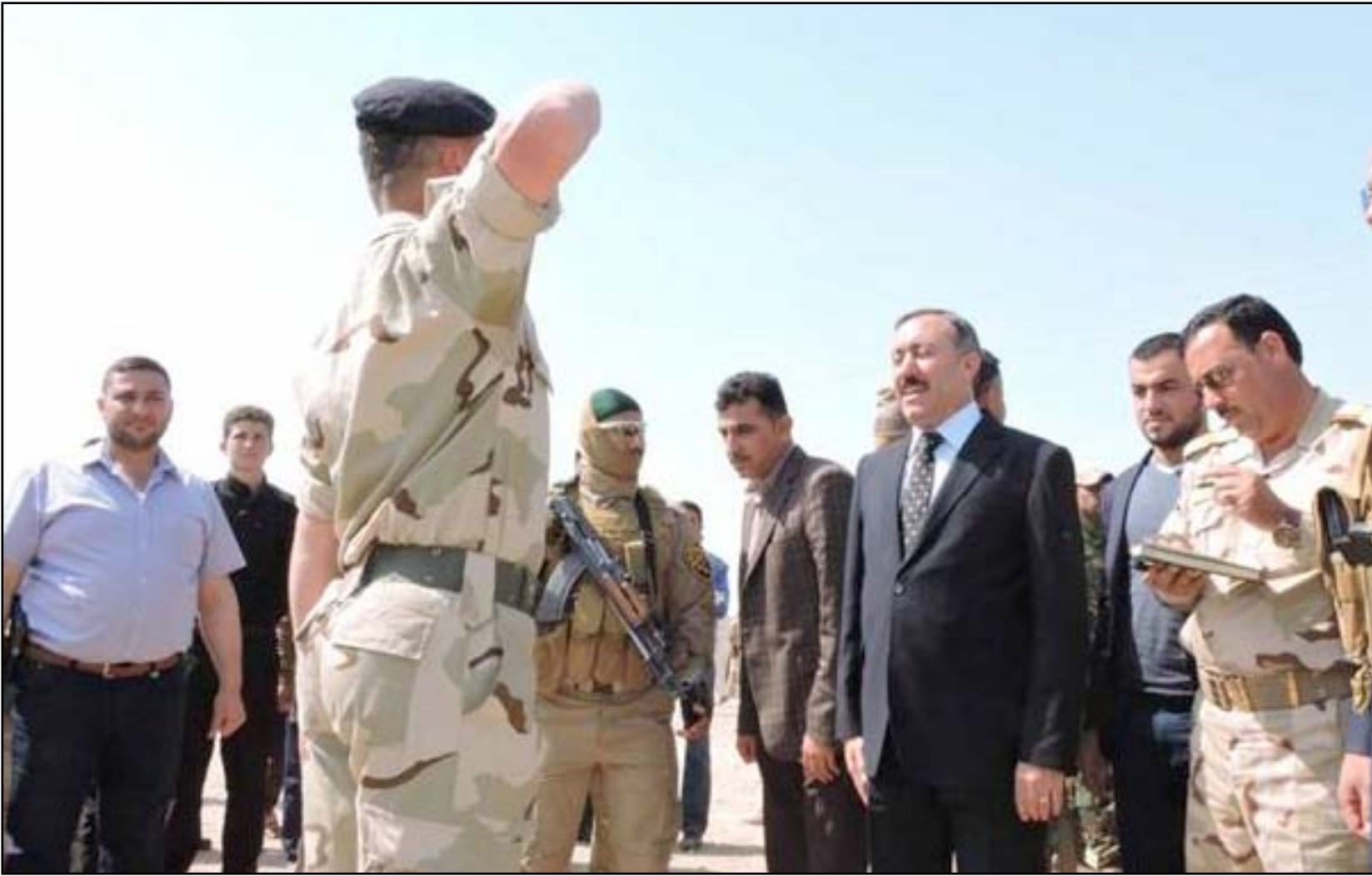
الفرجي خلال إحدى الزيارات لمسكر ليلان بكر كوك.. أرفيف

حدد أسامة النجيفي، نائب رئيس الجمهورية، أمس الأحد، أربعة تحديات مصيرية تواجه البلاد في الوقت الحالي، وفيما دعا إلى ضرورة ترسيخ مفهوم التعايش السلمي والشراكة الحقيقية بين جميع العراقيين، أكد أنه لا بديل عن الهوية الوطنية التي تحقق آمال وطموحات الشعب العراقي.