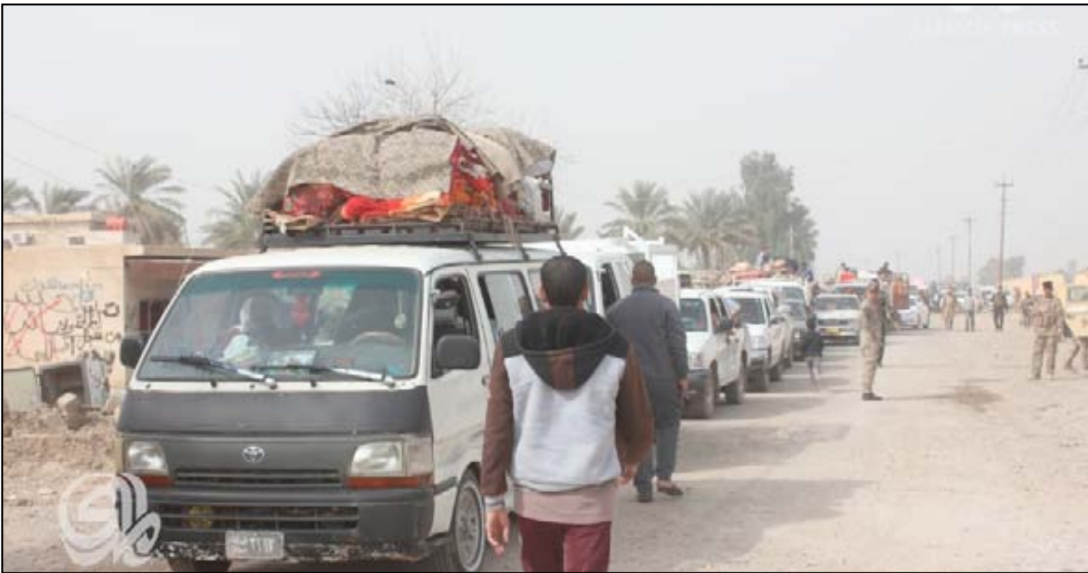
عائل نازحة خلال عودتها إلى محافظة ديالى