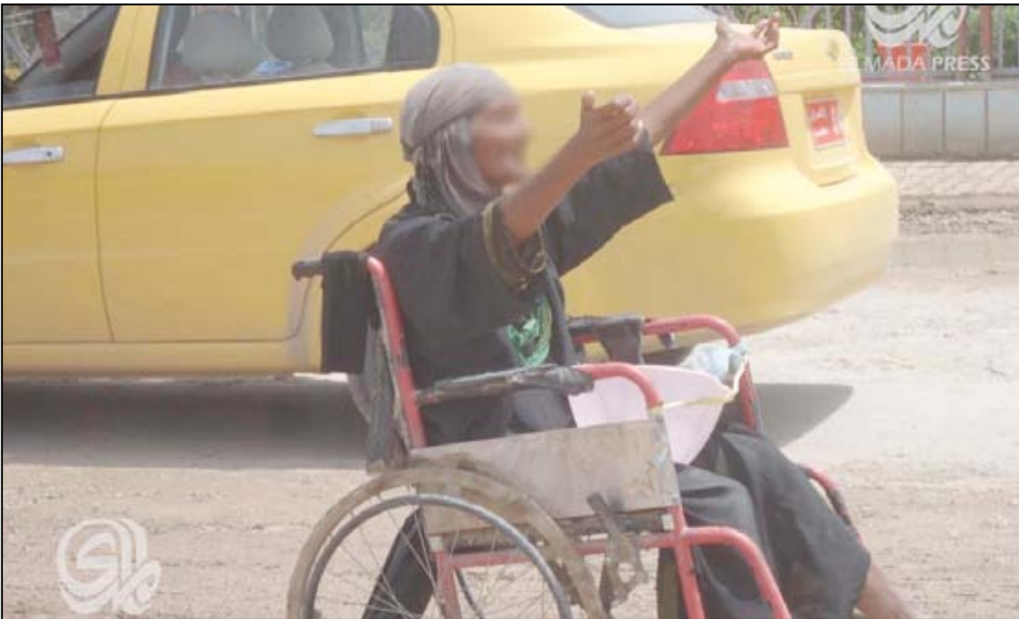
متسولة في مدينة الحلة

ناشطون طالبوا بتنظيم حملات تثقيفية واتخاذ "إجراءات فورية" بحق المتسولين